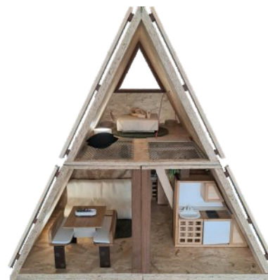
Opción con cocina