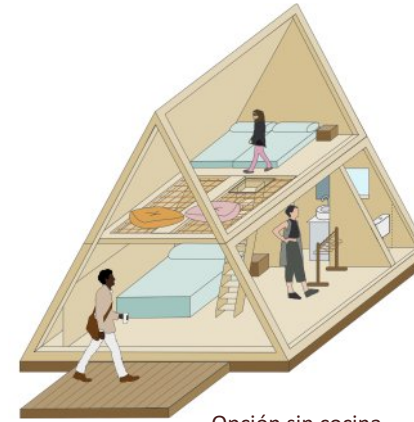
Opción sin cocina